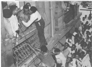
عبد الناصر مع الجماهير